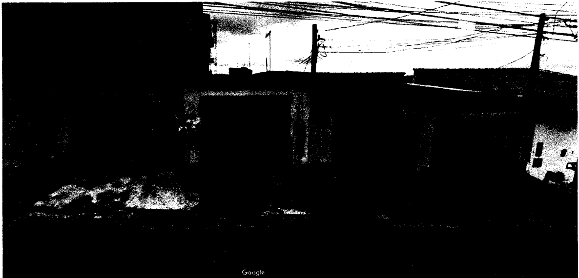
INSTALAÇÃO DE REDUTOR DE VELOCIDADE TIPO LOMBADA na Rua Juraci,693- Vila Cintra, Mogi das Cruzes